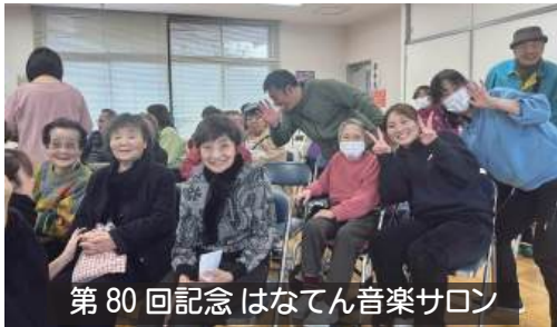
第80回記念 はなてん音楽サロン