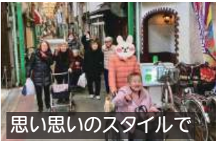
思い思いのスタイルで