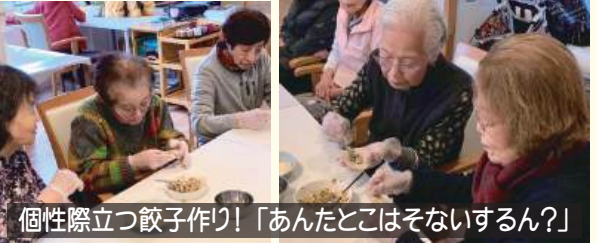
個性際立つ餃子作り! 「あんたそこはそないするん?」

手作り餃子の日!! さすがお母さん連合! 手際の良さは抜群で。個性的な形のもあるし監督役のワタシや食べるの専門のアナタも居られてそれがまたみつるぎらしさ。フロアに立ち上るいい匂い…またまた食欲アップ UP!