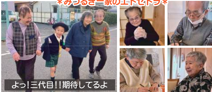
よっ!三代目!!期待してるよ