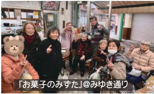
「お菓子のみすた」@みゆき通り

通い慣れた商店街、馴染みの店でお買い物。音楽を聞いたり、仲良しさんとおしゃべりしたり…「いつもの暮らしの継続」を楽しんで。