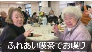
ふれあい喫茶でお喋り