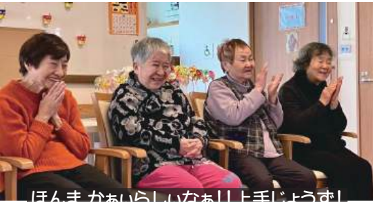
ほんま かあらしいなあ!!上手じょうず!

母が愛するこの場所で、クリエイターとしての瑞々しいまざしを活かしながら、ご利用者の日常を鮮やかに写し出そうとする彼女。親子二代で紡ぐ新しい物語が、みつるぎの里に温かな風を吹き込んでいます。