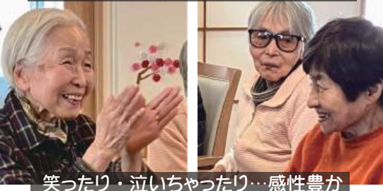
笑ったり・泣いちゃったり…感性豊か

厳冬の影響で、延期になっていた交流会。笑顔の向こうに可愛い天使の姿が浮かぶよう。皆で準備したお土産をお話ししながら手渡しました。それにも悔しいほどの笑顔!! 天使には敵いません。笑顔は観る人に幸せを運びます。公園散歩での出会いから始まった園児との交流。暖かくなるのが待ち遠しいです。