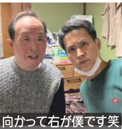
向かって右が僕です笑

大学時代の友人と中年親父の休日を楽しんだ。朝護孫子寺を観光した後、亀の瀬地すべり歴史資料館へ。2時間弱の無料のガイドツアーにも参加し、地すべりによる大和川の決壊を決して派手ではなく、静かに防ぐ人間の知恵を友人と真剣に学んできた。(興味があればお調べ下さい)